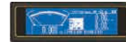
Display gráfico XL